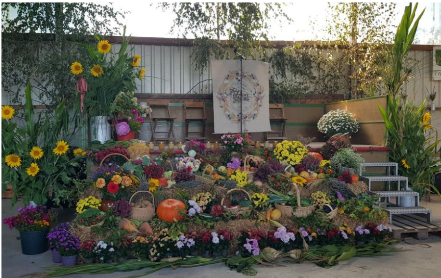
Hoferntedankfest auf dem Hof Nolting, Silixen, 24. September