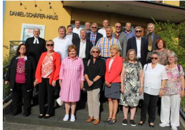
Goldene Konfirmation am 10. September