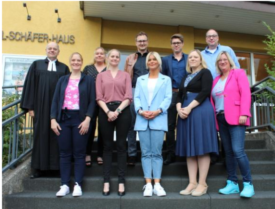
Silberne Konfirmation am 27. August