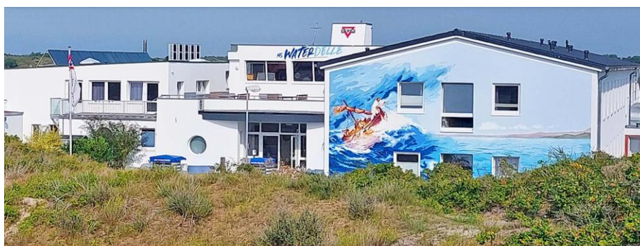
Willkommen an Bord der MS Waterdelle Die CVJM-Jugendherberge in den Dünen Borkums

Die Anreise erfolgt mit dem eigenen PKW bis zum Fährhafen Emden oder vorzugsweise (kürzere und günstigere Fährfahrt) Eemshaven (NL). Aus Kostengründen empfiehlt es sich, von dort ohne PKW auf die Fähre zu steigen. Auf Borkum angekommen, fährt man auf dem größten Streckennetz der Nordseeinselbahnen mit der Borkumer Kleinbahn. Nach einem kleinen Spaziergang (20-30 Minuten) durch die Innenstadt oder entlang der